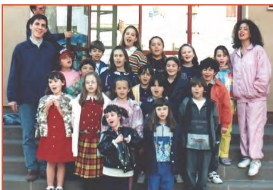
Una delle prime formazioni del Coro Doremix del 1997 ...

Dopo l'adesione alla Federazione Cori avremo la possibilità e l'occasione di seguire maggiormente l'attività di questo Coro del quale, sicuramente, parleremo ancora e molto.