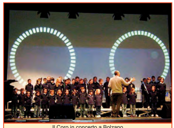
Il Coro in concerto a Bolzano