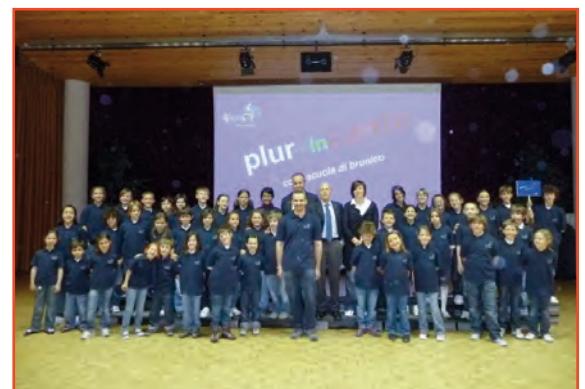
I piccoli coristi con le nuove uniformi e, sullo sfondo, il logo del Coro

Vista l'ottima prestazione il coro prosegue nelle prove e, grazie anche ad alcuni sponsor, vengono acquistate delle magliette con il logo della scuola.