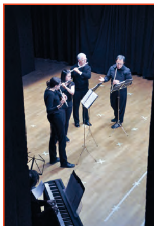
Alcune immagini dei gruppi impegnati nel Concerto di Bronzolo