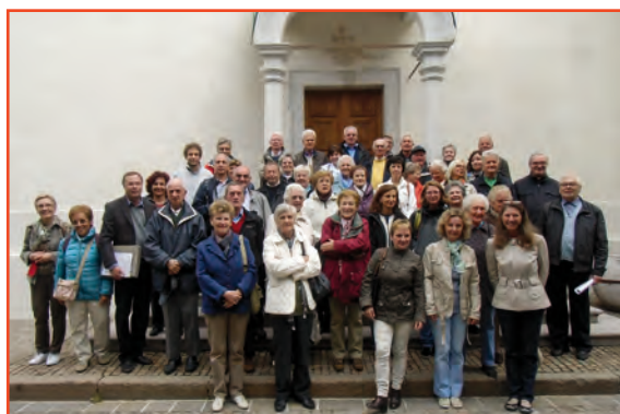
La Corale Santo Spirito sul sagrato della Basilica di Ampezzo

La giornata ha avuto poi un lieto momento conviviale nella caratteristica baita ampezzana di Rio Gere, ai piedi del Cristallo. Una trasferta breve ma ricca di emozioni anche perché i legami con Cortina non sono affatto cancellati proprio grazie al ricordo dei numerosi sacerdoti di Cortina che si sono presi cura della comunità italiana brissinese.