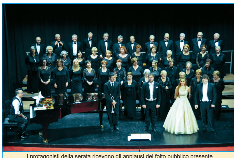
I protagonisti della serata ricevono gli applausi del folto pubblico presente