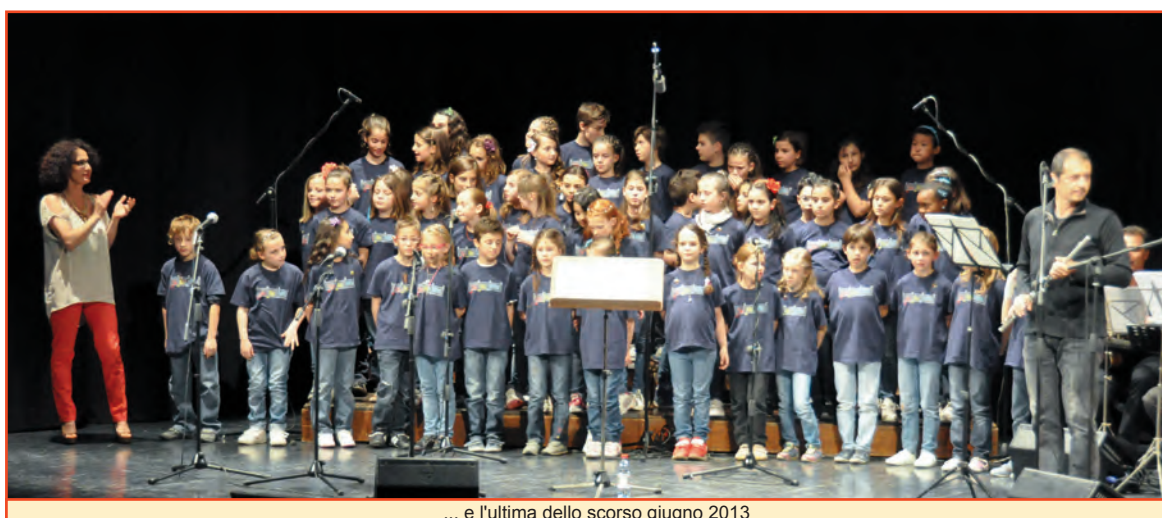
... e l'ultima dello scorso giugno 2013