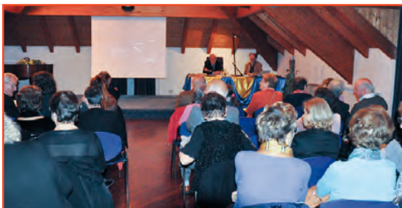
L'attento pubblico della conferenza

Il suo "Tutto nel mondo è burla" non è solo il distacco dell'uomo dalla vita, è anche un burlarsi di tante lacrime e sospiri, di tutto un mondo da lui creato e vissuto, di una società che lo aveva ora vilipeso, ora osannato.