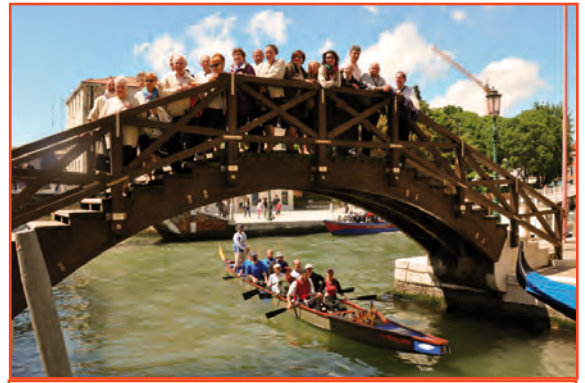
Sui ponti di Venezia