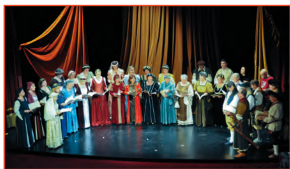
La Corale I Cantori del Borgo sul palco del Teatro Puccini