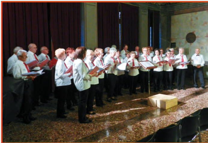
La Corale ANTEAS a Malcesine

Il pubblico era numeroso e alla fine ha calorosamente applaudito e ha chiesto parecchi bis. Naturalmente i coristi sono