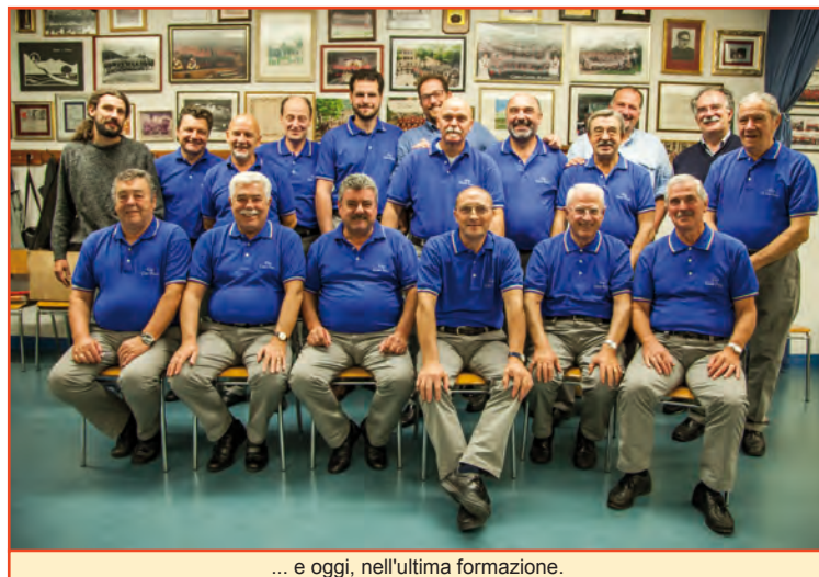
... e oggi, nell'ultima formazione.