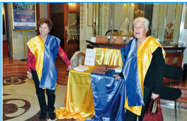
Un grazie ai volontari/e sempre presenti a promuovere la Federazione