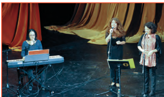
Il gruppo S.A.M Session