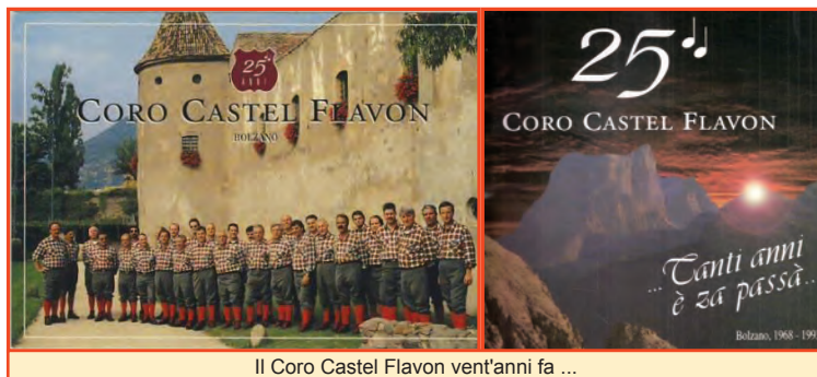
Il Coro Castel Flavon vent'anni fa ...

M e s s o alle spalle il periodo trascorso e con l'esperienza di tanti anni il Coro Castel Flavon ha grossi obiettivi e mire per il futuro; uno per tutti il festival dei Cori in Brasile, oltre a manifestazioni importanti, delle quali sicuramente ripareremo ben prima del cinquantenario alle cui manifestazioni già si comincia a pensare.