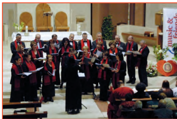
La Corale Santo Spirito durante una delle esibizioni

Qui l'attendeva una guida che l'ha accompagnata nella visita al centro cittadino, ai monumenti ed ai preziosi mosaici, dichiarati patrimonio dell'umanità dall'Unesco, nonché la ricca storia che aveva permesso il sorgere di tali monumenti, essendo stata Ravenna per ben tre volte capitale: dell'impero romano d'occidente, del regno dei Goti e dell'esarcato bizantino.