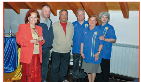
La Presidente Paternoster con alcuni volontari dell'organizzazione