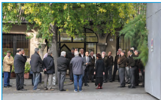
Sullo sfondo la sede della Federazione dei Cori, luogo dell'incontro