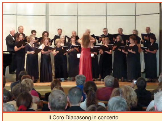
Il Coro Diapasong in concerto

Dopo i concerti in primavera a Bolzano e le prove estive, grande è stata l'emozione alla partenza e il 30 luglio eravamo in Islanda! La