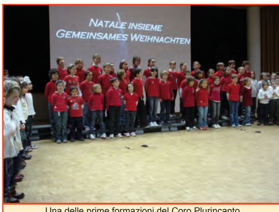
Una delle prime formazioni del Coro Plurincanto

Giunge poi il momento della prima trasferta a Bolzano, davanti ad un pubblico diverso e a fianco di altri cori scolastici già affermati: è subito un vero successo, i ragazzi si dimostrano professionali, compostissimi e... soprattutto bravi, strappando applausi e richieste di bis.