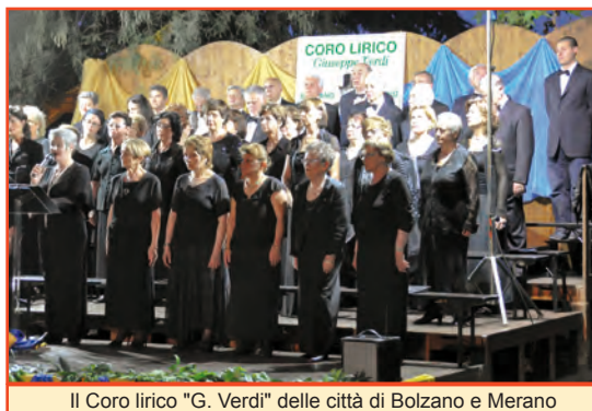
Il Coro lirico "G. Verdi" delle città di Bolzano e Merano