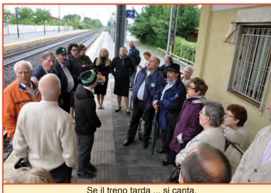
Se il treno tarda ... si canta.

Sono esperienze soddisfacenti che consolidano i buoni rapporti interpersonali nel gruppo e sono di stimolo per continuare l'impegno con entusiasmo.