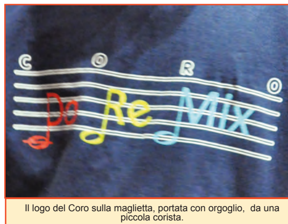
Il logo del Coro sulla maglietta, portata con orgoglio, da una piccola corista.

Nella scelta di tali eventi viene data precedenza ai gemellaggi con altre formazioni musicali (per permettere ai bambini di conoscere realtà musicali diverse) ed ai concerti che sostengono progetti umanitari.