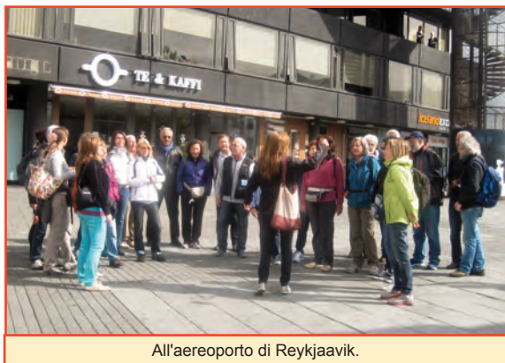
All'aeroporto di Reykjaavik.

potevano caratterizzare la nostra vocalità di coro italiano.